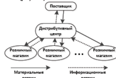
Рис. 1. Цепь поставок «как есть».

Моделируемая цепь поставок состоит из поставщика, дистрибутивного центра розничного торговца и розничных магазинов (рисунок 1).